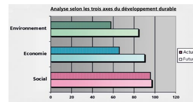
Analyse selon les trois domaines du développement durable

d'araignée permet de visualiser les résultats chiffrés et de mettre en évidence les points forts et les points faibles de la commune.